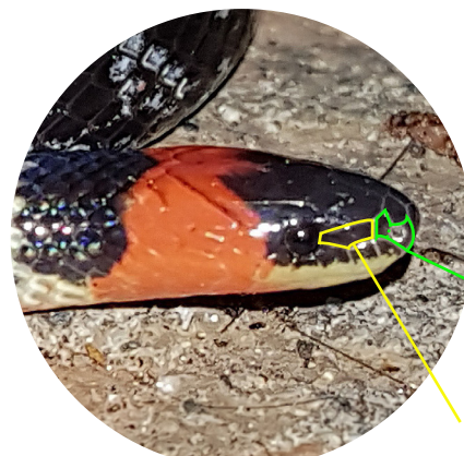
No tiene escama preocular.