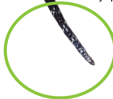
Cola SIN anillos rojos.