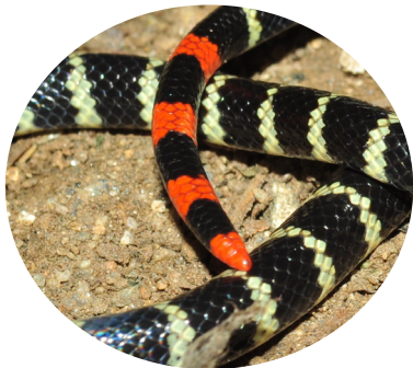
Cola CON anillos rojos.

Cuerpo negro con franjas claras a los lados que pueden unirse en la región dorsal. Este patrón NO continúa en el vientre, siendo este claro o naranja. Su cabeza es negra con una franja roja posterior a los ojos.