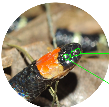
No tiene escama loreal.